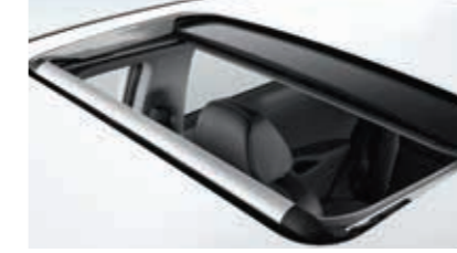
Elektrikli Açılır Cam Tavan / Krom Kapı Kolları