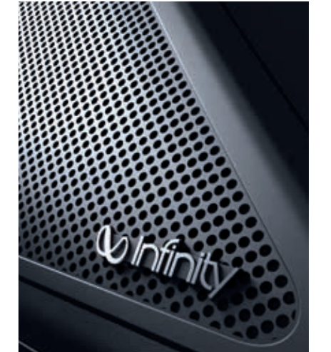
Infinity Premium Ses Sistemi