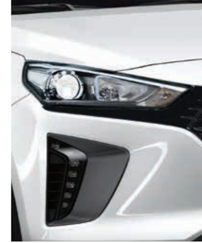
Projeksiyon Tipi Ön Farlar