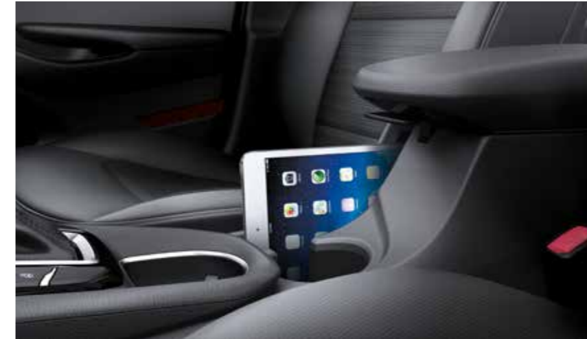
Geniş Orta Kol Desteği