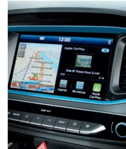
8" Bilgi - Eğlence Sistemi