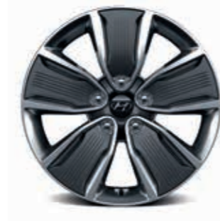
17" alaşım jantlar