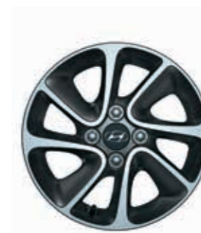
14 İnc 8 Kollu Tasarım Alaşım jant (çift renkli)