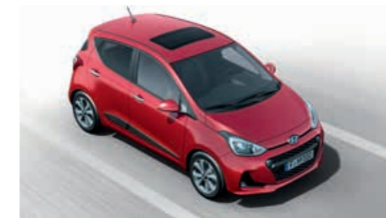
Şerit Değişirme Uyarı Sistemi (LDWS) Çok fonksiyonlu kamera, şeridinizden çıktığınızı algılıyor ve gerektiği durumlarda sizi sesli ve görsel olarak uyarıyor.