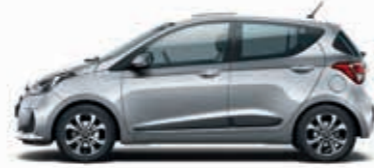
Kurşun Gri (RYS-Metalik) + Koyu Gri (TMT), Bej (YBE), Kırmızı (MRE)