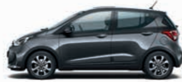
Çakıl Gri (U3G-Metalik) + Koyu Gri (TMT), Bej (YBE), Kırmızı (MRE)