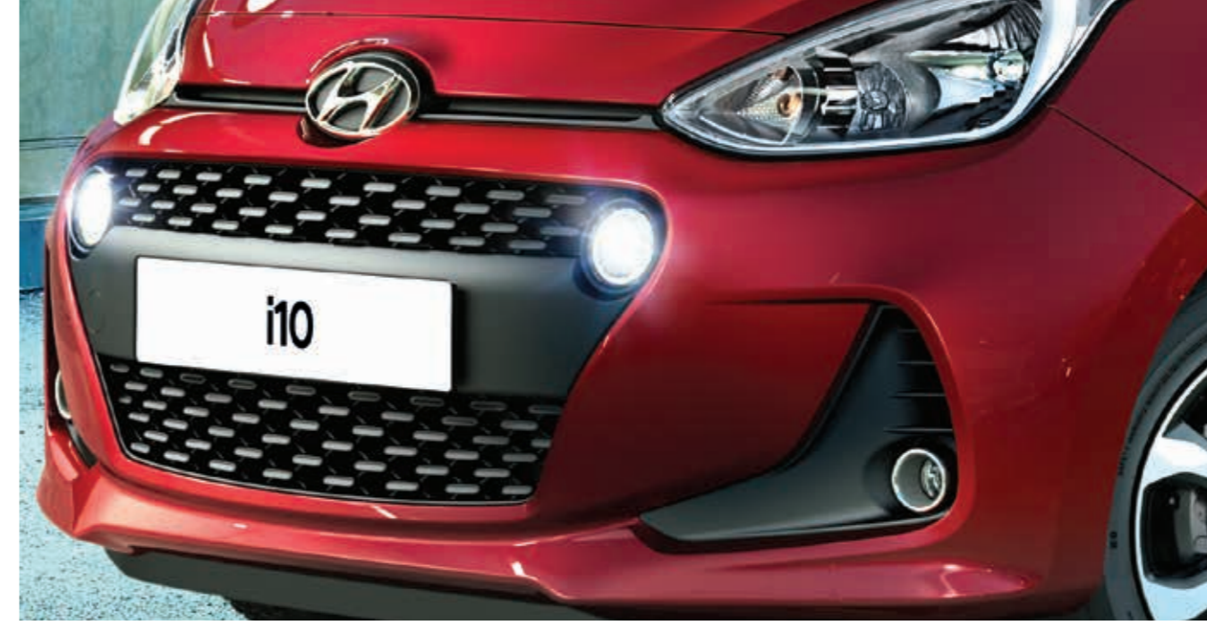
LED Gündüz Sürüş Farları ve Yeni Tasarım Ön Izgara Yeni yuvarlak biçimli LED Gündüz Sürüş Farları ve yeniden tasarlanan ön izgara, i10'a sportif bir görünüm kazandırıyor.