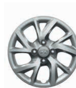
14 İnc 5 İkiz Kollu Tasarım Jant kapağı (metalik gri)

3 farklı jant seçeneği, i10'un görünümüne katkıda bulunuyor.