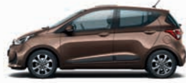
Kaşmir Kahve (X9N-Metalik) + Koyu Gri (TMT), Bej (YBE)