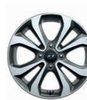
15 İnc 5 İkiz Kollu Tasarım Alaşım jant (çift renkli)