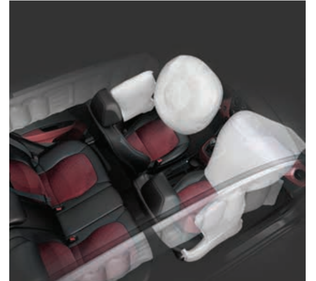
Yan ve Perde Hava Yastıkları Sizi her yolculuğunuzda koruyor, size sadece yolculuğun keyfini çıkarmak kalıyor.