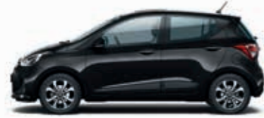
Mika Siyah (X5B-Sedefli) + Koyu Gri (TMT), Bej (YBE), Kırmızı (MRE)