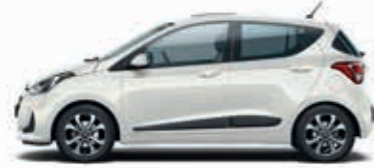
Kutup Beyazı (PSW-Opak) + Koyu Gri (TMT) Bej (YBE)

Renk, jant, iç döşeme ve torpido rengi seçimlerinizi yaparak i10'unuzu kişiselleştirin.