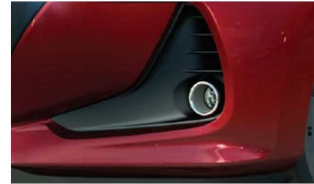
Projeksiyon Sis Farları ve Ön Hava Kanalı Projeksiyon sis farlarını çevreleyen hava kanalları i10'un sportif görünümünü tamamlamakla kalmıyor, aracın aerodinamiğine de katkı sağlıyor.