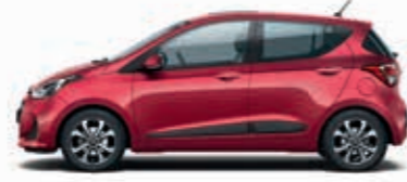
Alev Kırmızı (X2R-Sedefli) + Koyu Gri (TMT), Kırmızı (MRE)