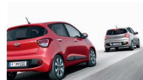
Ön Çarpışma Uyarı Sistemi (FCWS) Öndeki araca tehlikeli bir şekilde yaklaştığınızda sizi uyararak daha güvenli bir yolculuk yapmanızı sağlıyor.