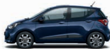
Derin Mavi (X3U-Opak) + Koyu Gri (TMT), Mavi (MBX)